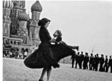
UMWEG (1981) und OH! DIE VIER JAHRESZEITEN (1986)

over the country. Many of the films in this program are made by women, dealing particularly with female aesthetics. Three of the films are from the Berlin Film School, which has had a history of producing only political documentaries. But during the last years, a radical change has come about towards a more experimental film language, developed mostly by female students there (Aurand, Jahn, Rosi S. M.). 4